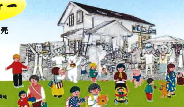
於：龍ヶ崎コミュニケーションハウス隣地 (龍ヶ崎市川崎町6番地)